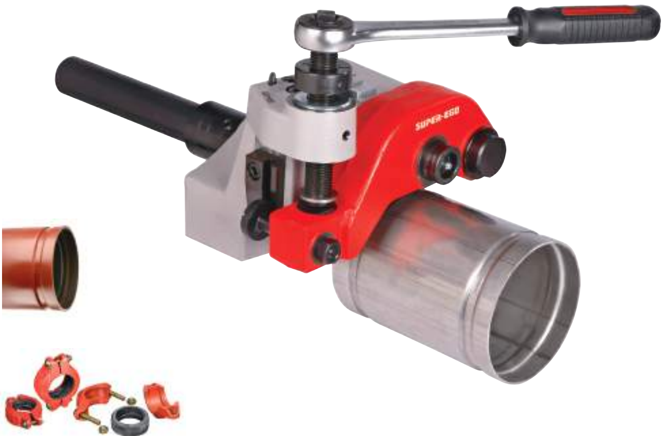
Accesorios para tubos ranurados. Accesorios para tubos ranurados.